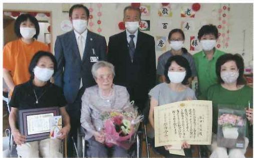
笛吹市100歳慶祝訪問