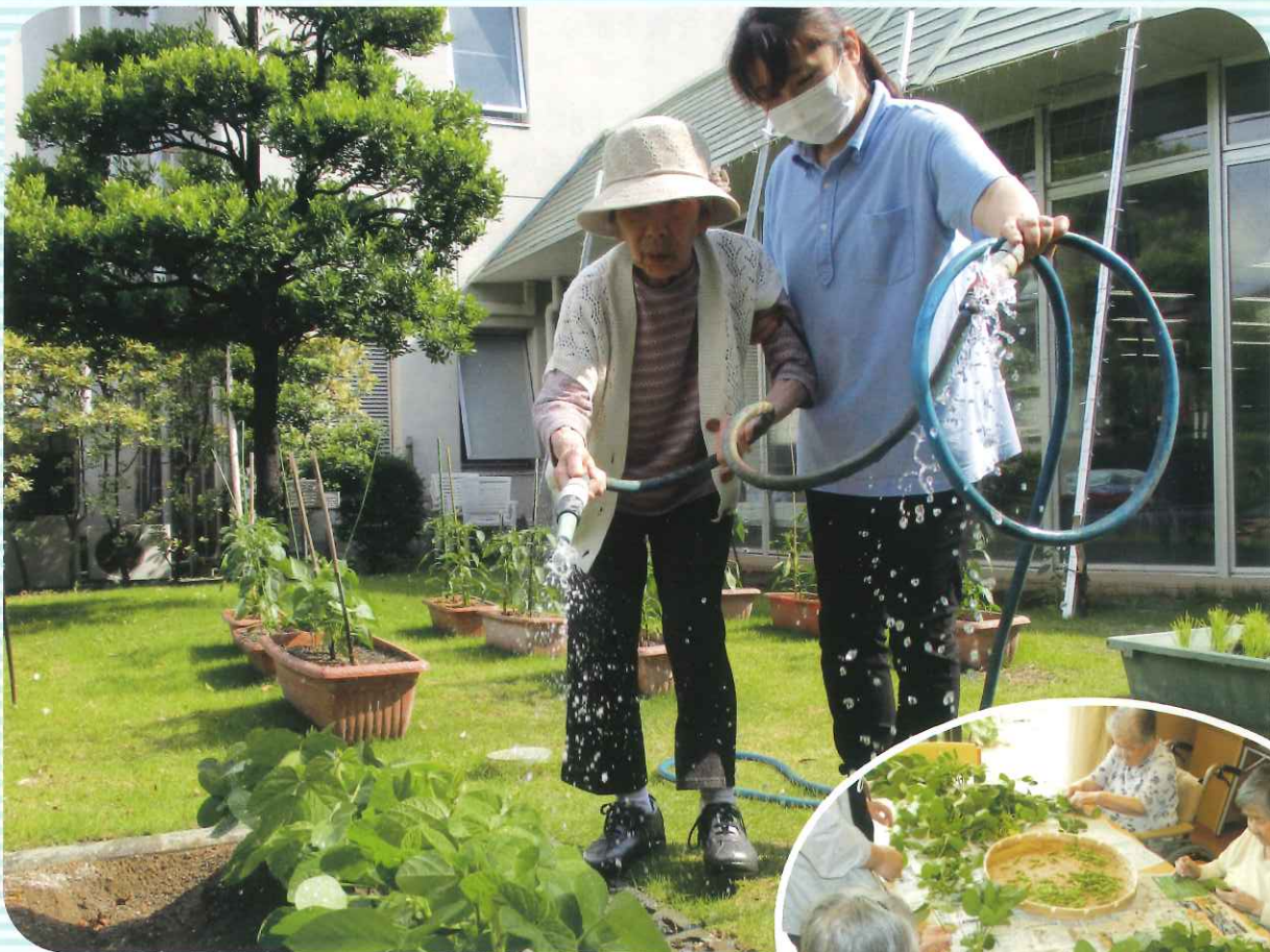
野菜の水やり 美味しくなあれ