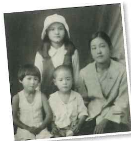
後列中央で帽子をかぶっている