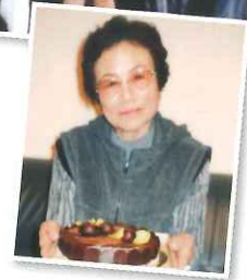
ケーキを持っている